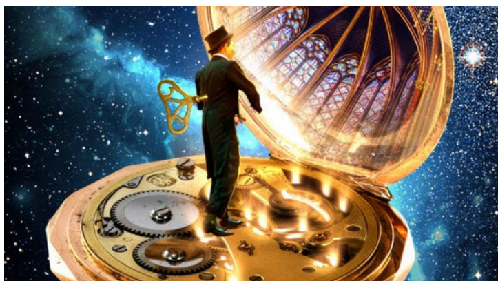
Un Noël hors du temps

La tournée «Noël des Cathédrales» sillonnera des lieux magnifiques avec une nouvelle création de Luc Petit sur un texte original de Michel Teheux.